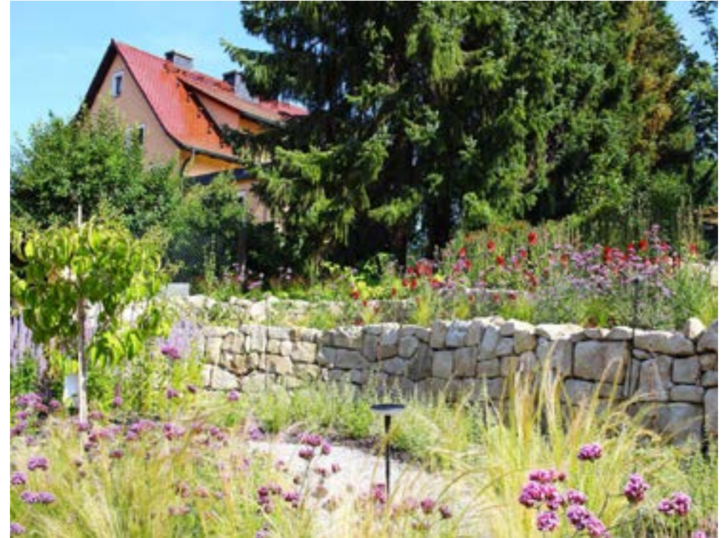
Dein Gartenraum Steffen Langbein Schweizergartenstr. 1e, 04808 Wurzen

Planung: 360° Landschaftsgestaltung Bäume erhalten – Landschaften gestalten