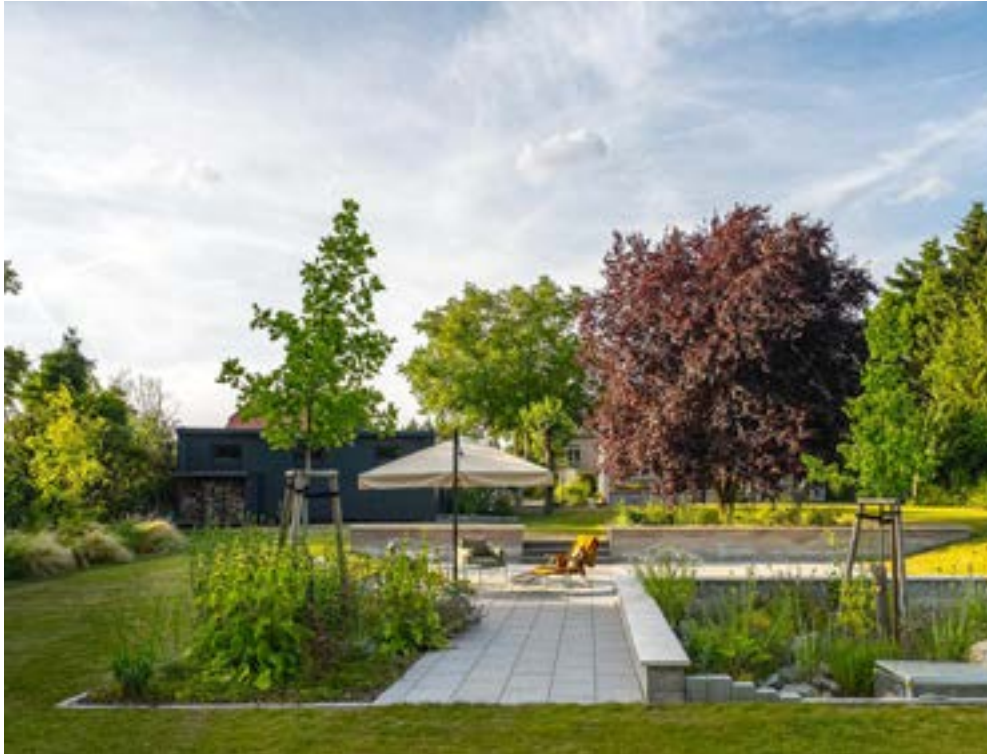
360° Landschaftsgestaltung Bäume erhalten – Landschaften gestalten Schönbrunnstr. 13, 01097 Dresden

Projekttitle: Vor den Toren Leipzigs – Natur neu inszeniert Leipzig